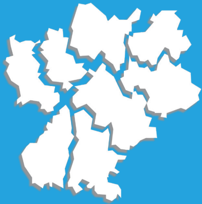
TABLEAU DE BORD 2010

STATISTIQUES ET INDICATEURS DU HANDICAP ET DE L'INSERTION PROFESSIONNELLE EN RHÔNE-ALPES