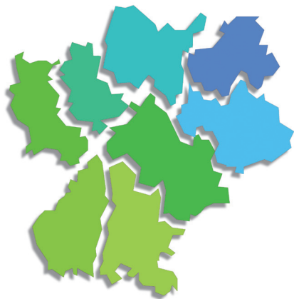
TABLEAU DE BORD 2010

STATISTIQUES ET INDICATEURS DU HANDICAP ET DE L'INSERTION PROFESSIONNELLE EN RHÔNE-ALPES